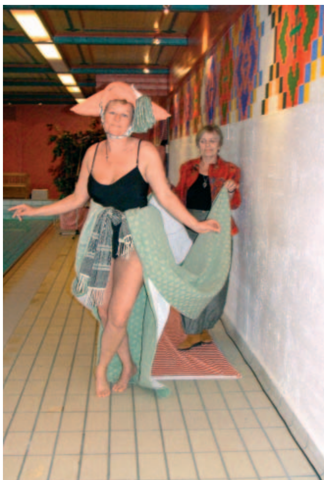
Hvilket brudepar ved bassinkanten!