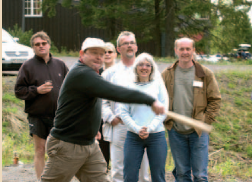
Den årlige dyst i rundbold er en tradition på Nordisk FreelanceSeminar

Dokumentarfilmen kom tæt på den ikke så professionelle unge norske kvinde og den langt mere erfarne russer og deres vanskeligheder af forskellig art tværs over grænserne. Filmen varede en time, og det var ikke for meget.