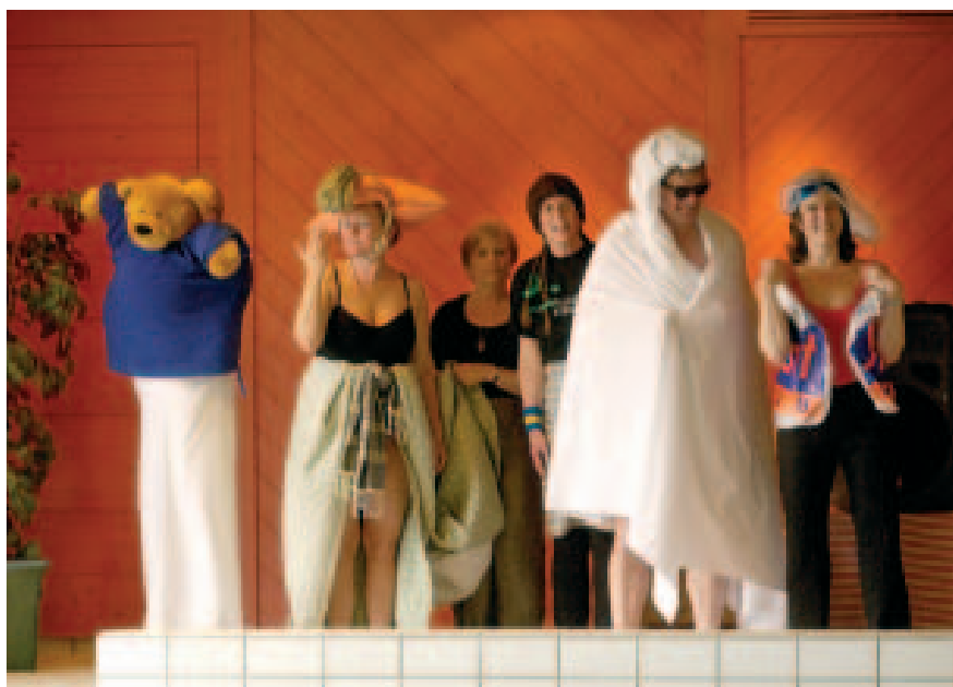
Deltagere på catwalken.