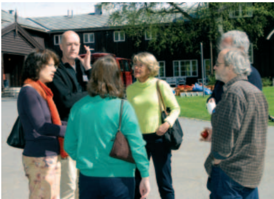
Pausene ble benyttet av ivrige seminardeltakere til å diskutere videre hva som skiller og forener.

Det andre er prisnivået! Kan det her være noen sammenheng? 50 kroner for en flaske øl er drøy kost – selv for en dreven frilanser.