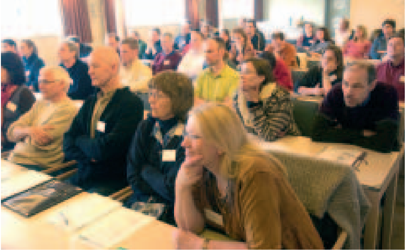
På seminaret deltok 75 frilansere fra Danmark, Finland, Sverige og Norge.

identiteter som mer bygger på ulikheter enn på likheter.