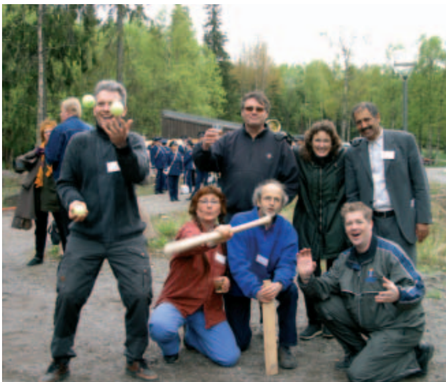
Tradisjonen tro var det vertslandet som vant årets nordiske turnering i brennball.