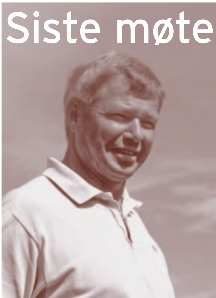
Statsminister Kjell Magne Bondevik er kampklar foran høstens valg.

Selv om det blåser friskt på båtturen ut til Citadelløya er det ekstra stort oppmøte i år og mye aktivitet nedenfor festningsvolden. Det er en sommerbrun og avslappet statsminister som håndhilser på de fremmøtte, og småprater mens han koser seg med en tallerken fiskesuppe før han tar fatt på pressekonferansen. Han starter med å si at han har hatt en god sommerferie, for det meste på hytta utenfor Stavern, men også i Molde, med mye sol, familie, venner og fotball, som har gitt ham veldig mye god energi. Og det kan han trenge, for tar man en titt på programmet hans frem til valget kan man miste pusten av mindre.